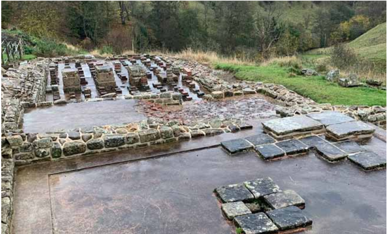
Afb. 32 Funderingen van het badhuis bij fort Vindolanda.

De kinderen in de wijk willen heel graag met water spelen. Een Romeins geïnspireerde waterspeelplaats zou perfect het erfgoed met de huidige wensen verbinden.