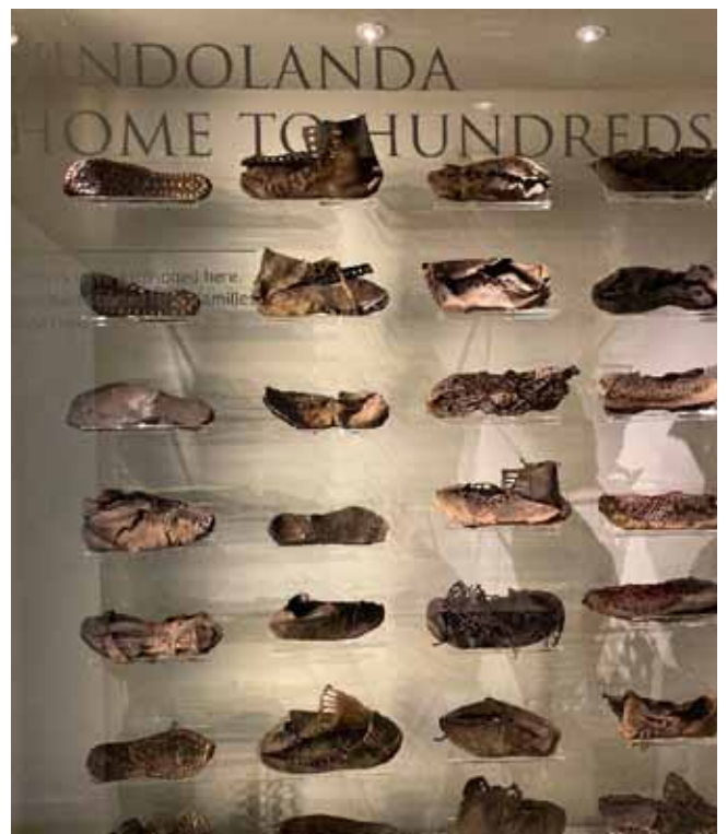
Afb. 13b Schoenen uit Vindolanda

Deze menselijke kant van de soldaten in het Romeinse leger, vrouwen, kinderen, lokale bewoners en tot slaaf gemaakten, maakte veel indruk op ons reisgezelschap.