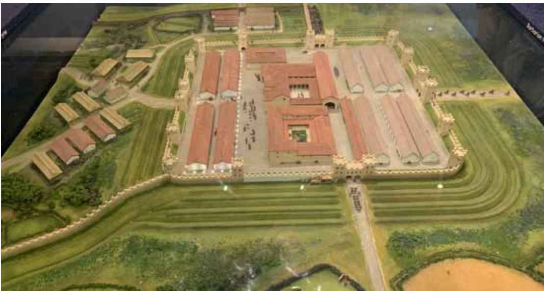
Afb. 27 Maquette van fort Segedunum.

Kunnen we iets met de kleuren van de Romeinse tijd in de nieuwe wijk?