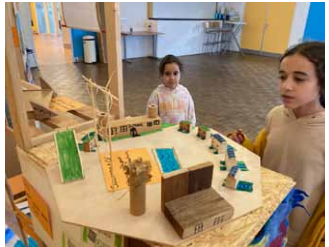
Afb. 8 Jong en oud zonden ontwerpen in voor de wedstrijd.

De winnaars kregen vrijkaartjes voor Museumpark Archeon, het Rijksmuseum van Oudheden en voor een limesvaartocht, om zo nog meer geïnspireerd te raken door het lokale erfgoed.