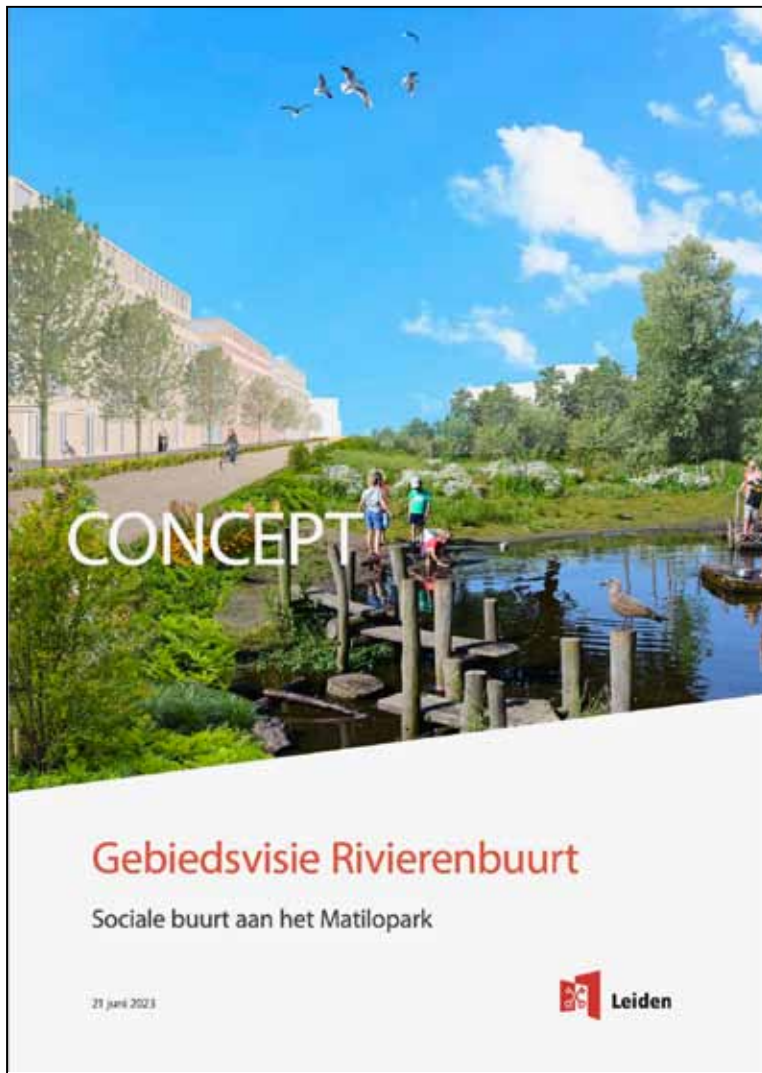
Afb. 19 De gebiedsvisie voor de Rivierenbuurt/Meerburg.

pen en een maquette. De ontwerpers leverden er tekst en uitleg bij en op panelen waren de aanbevelingen van de stakeholders te lezen, alsmede de reactie van de Gebiedsvisie daarop.