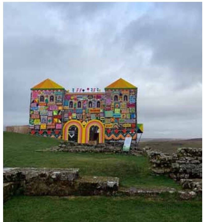
Afb. 13 Housesteads: de fundamenteën van de soldatenbarakken en de noordpoort, kleurrijk verbeeld met een gemeenschapskunstproject van Morag Myerscough.