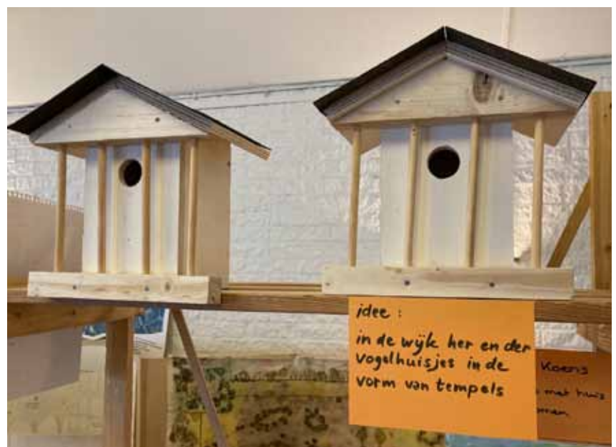
Afb. 9 Goede ideeën voor de nieuwe wijk.

De kinderen met een eervolle vermelding kregen archeologisch getinte kinderboeken en uiteindelijk waren er ijsjes voor iedereen, vooruitlopend op de door de kinderen zo gewenste ijsjeswinkel!