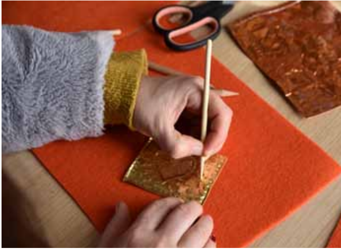
Afb. 25 Wenstabletten maken van goud- en bronsfolie.

Nu vonden wij vloektabletten niet zo'n goede 'vibe' voor onze werktafel, maar de techniek van embossen in metaal sprak ons wel aan, dus maakten we wenstabletten. In goud- of bronsfolie schreven en tekenden we onze