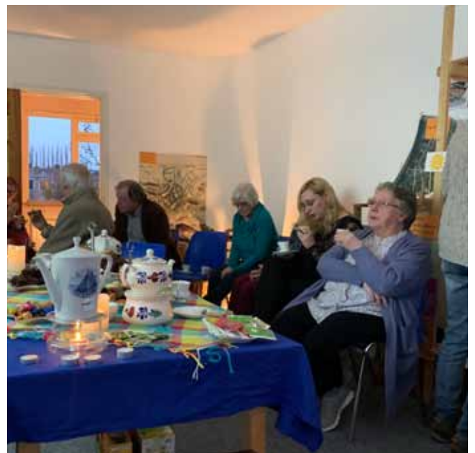
Afb. 18 Een heerlijke high tea in het projecthuis van Meerburg.

Daarna was het wachten op de gemeente en de woningcorporaties, die met een gebiedsvisie voor de nieuwe wijk zouden komen met input van de ideeën en wensen uit het participatietraject.