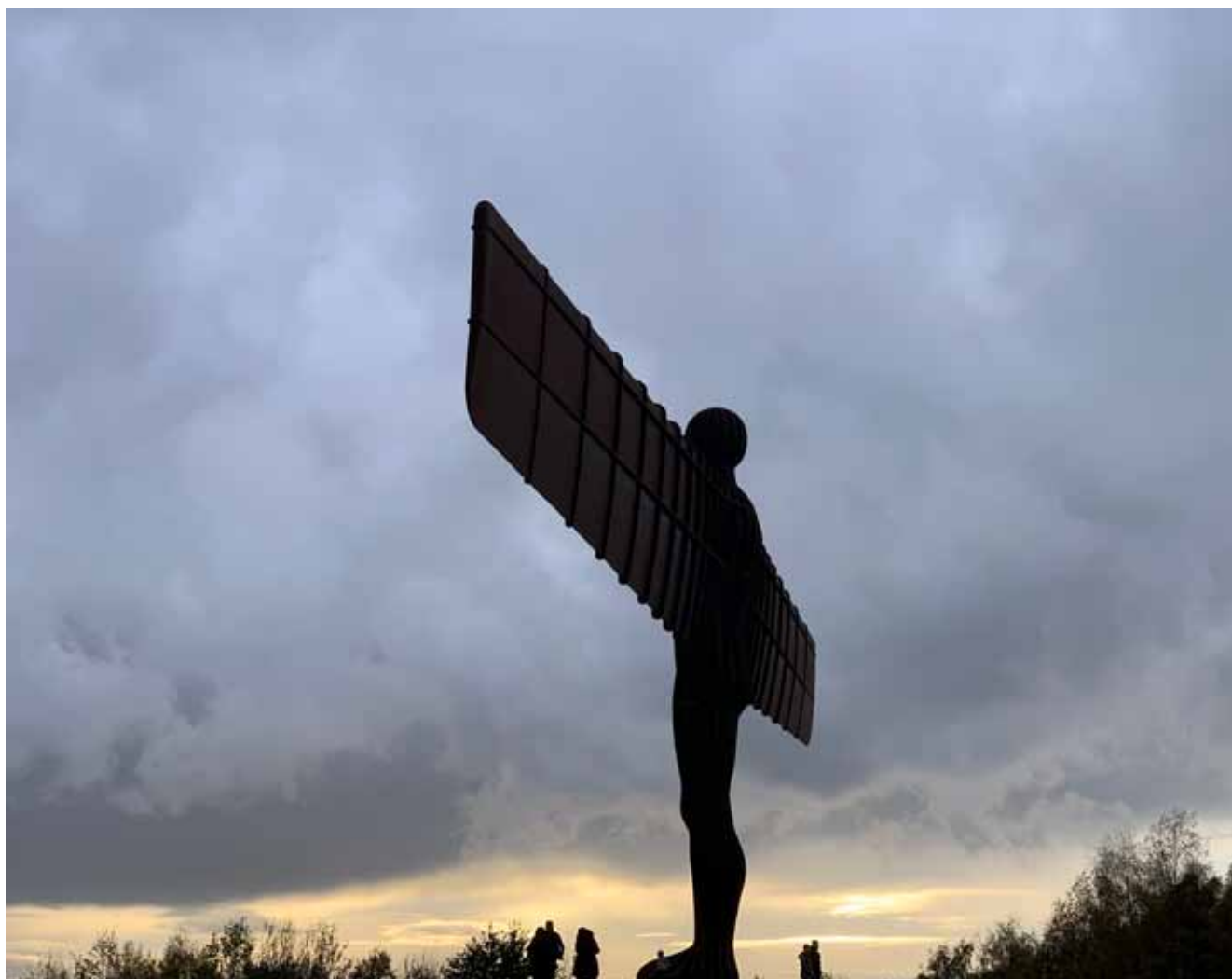
Afb. 17 Angel of the North van Anthony Gormley.

Een mooiere afsluiting was er niet te bedenken: voldaan, dankbaar en opgeladen met inspiratie reden we naar de boot om de terugreis aan te vangen.