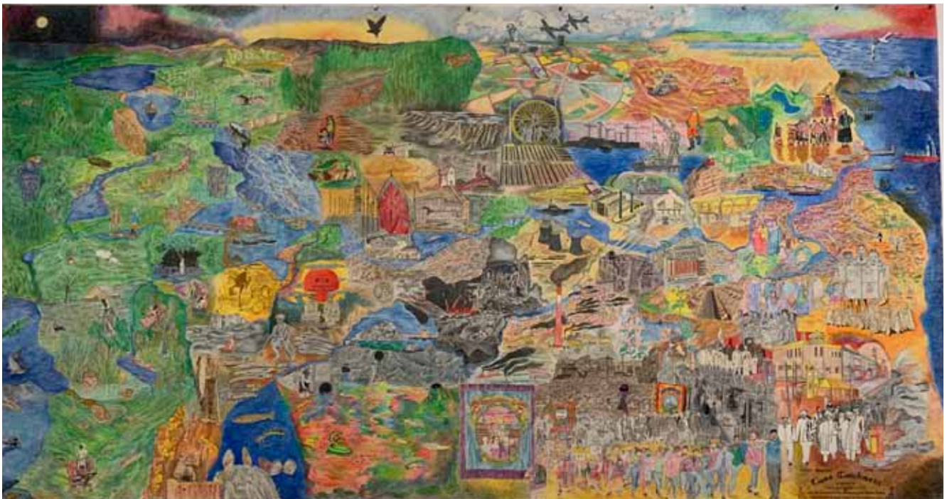
Afb. 16 'Tyne Catchment' van Carolina Caycedo.

erfgoed, kunst en landschap van Northumberland, bleek onder andere het werk 'Tyne Catchment' van Carolina Caycedo (Colombia, 1978) een intrigerend beeld te geven van een getekend landschap op groot formaat. Centraal hierin stroomde de rivier de Tyne. In en naast de rivier waren talloze gebeurtenissen afgebeeld uit de geschiedenis, mythologie, ecologie, culturele diversiteit en actuele klimaatkwesties die door de rivier en het landschap met elkaar waren verbonden.