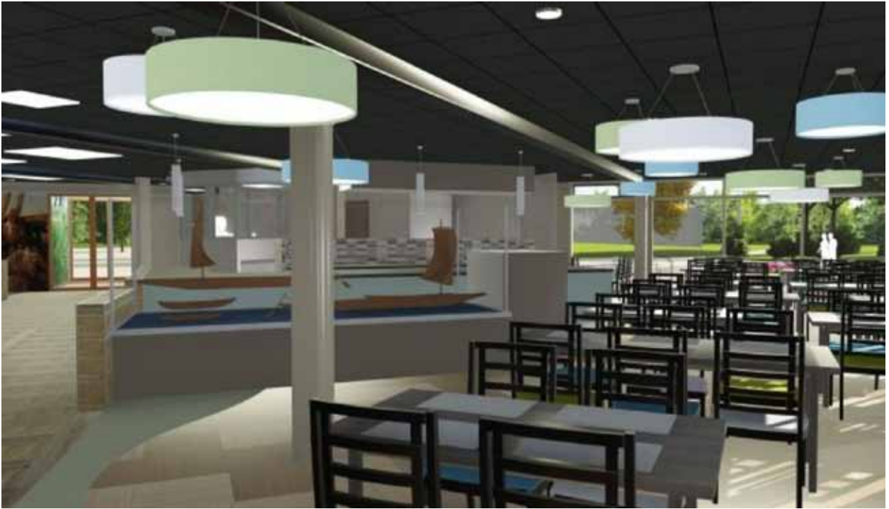
Afb. 23a Grand Café De Haven bij Ipse de Bruggen in Zwammerdam.

De economische component blijkt het lastigst in de praktijk te brengen. Hoe kan erfgoed bijdragen aan armoedebestrijding en werkgelegenheid? Twee dingen die in Meerburg zeker spelen en aandacht verdienen.