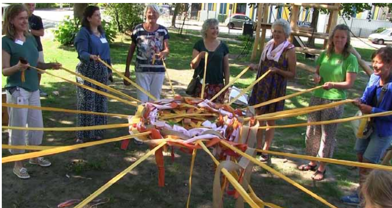
Afb. 21 De wijkbewoners zijn allen met elkaar verbonden.