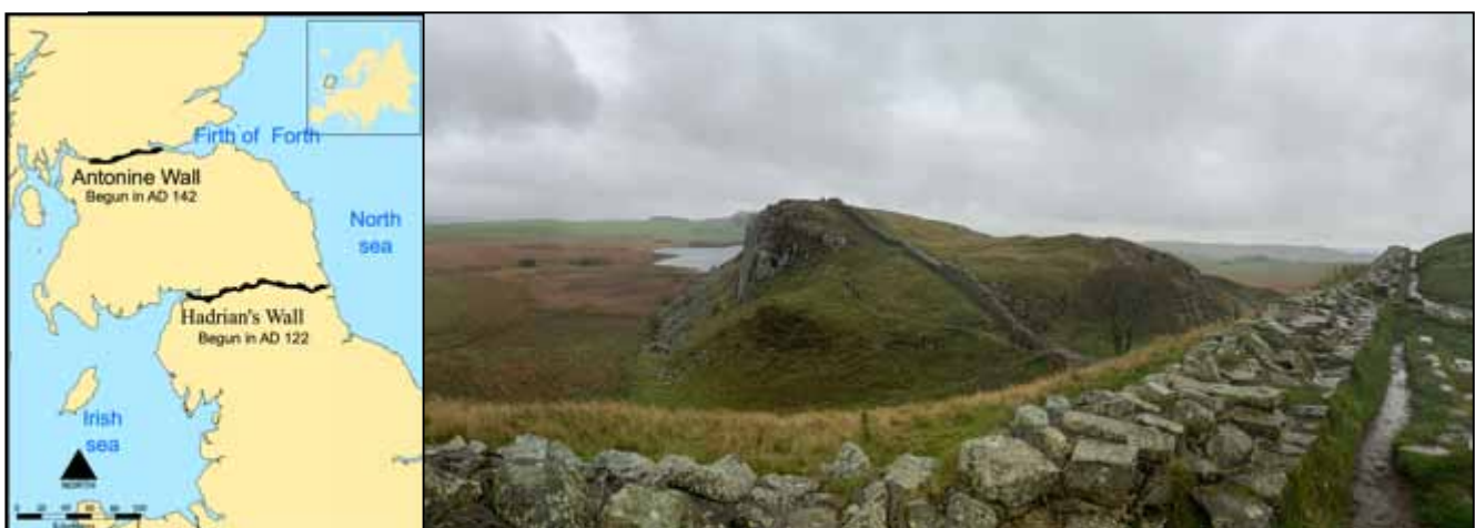
Afb. 10 De Muur van Hadrianus in Noord-Engeland.

De muur is 117 km lang en loopt van Bowness on Solway (bij Carlisle) in het westen tot Newcastle in het oosten.