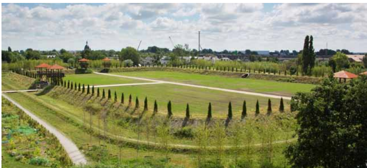
Afb. 5 Park Matilo, tussen de wijken Roomburg en Meerburg. Het Romeinse fort is gevisualiseerd met wallen en wachttorens, het fietspad volgt de loop van de oude Romeinse limesweg.

aan het begin van de jaren 2000 de wijk Roomburg wilde realiseren, kon zij niet bouwen op dit stuk van het terrein. Zij besloot tot de aanleg van een park in de vorm van het Romeinse fort, met wallen, wachttorens en een stukje van de oude limesweg: Park Matilo.