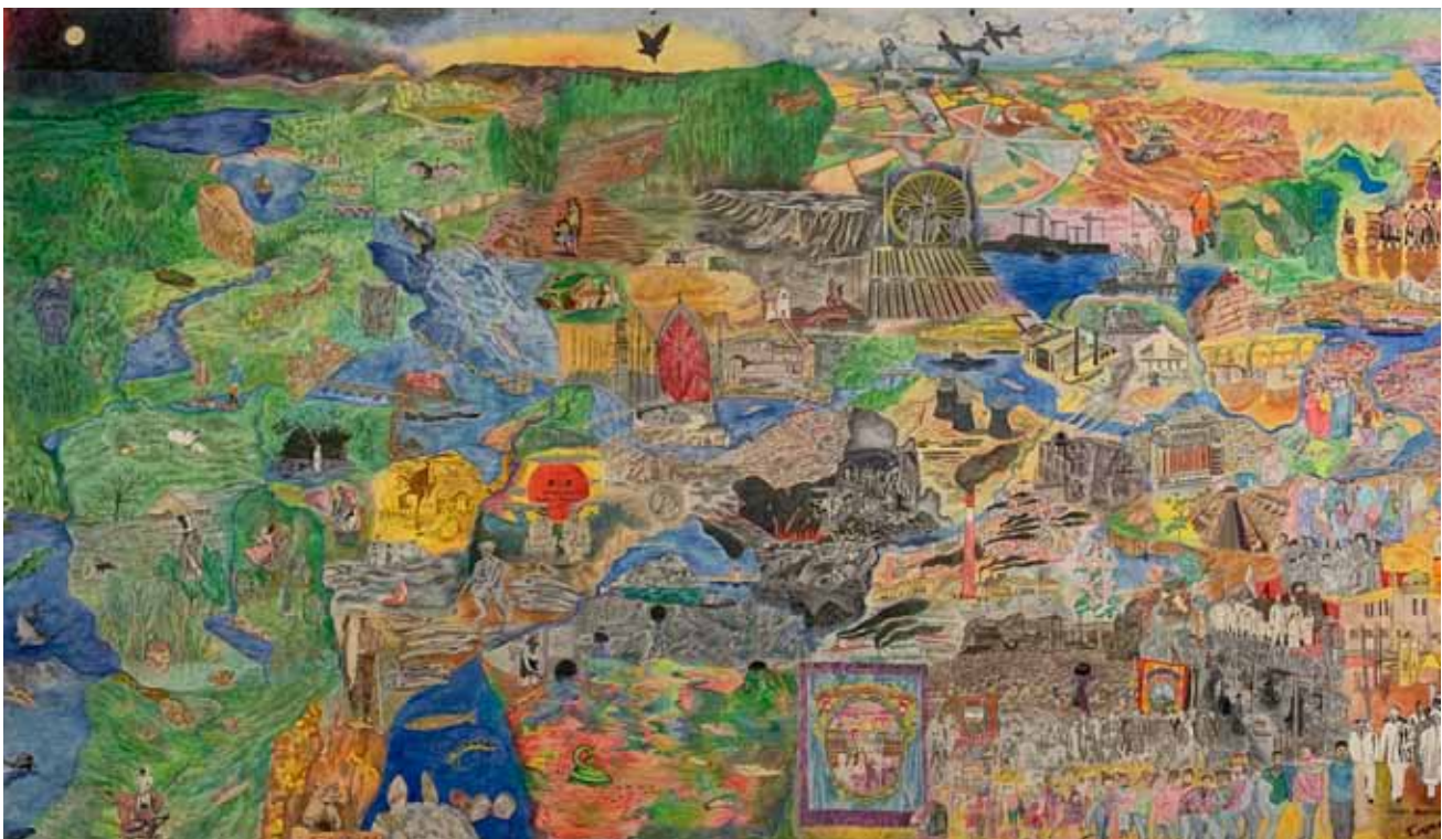
Afb. 29 'Tyne Catchment' van Carolina Caycedo, gezien in het Baltic Museum in Newcastle Upon Tyne.

Wat een mooi idee: muurgedichten volgens Leidse traditie, gemaakt door de bewoners van het vernieuwde Meerburg.