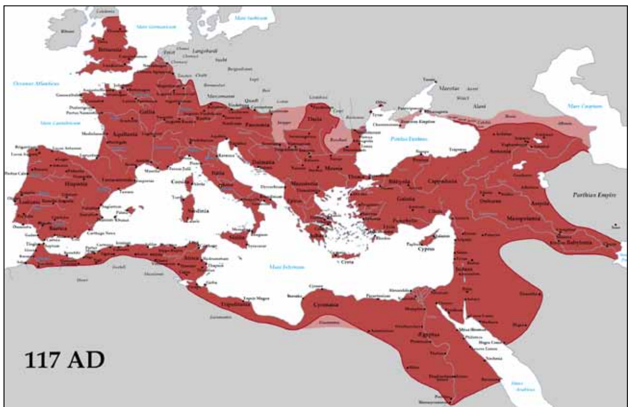
Afb. 2 Het Romeinse rijk in het jaar 117 na Chr. Het grensfort Matilo maakte deel uit van een wereldrijk en van een ca. 5000 km lange grens.