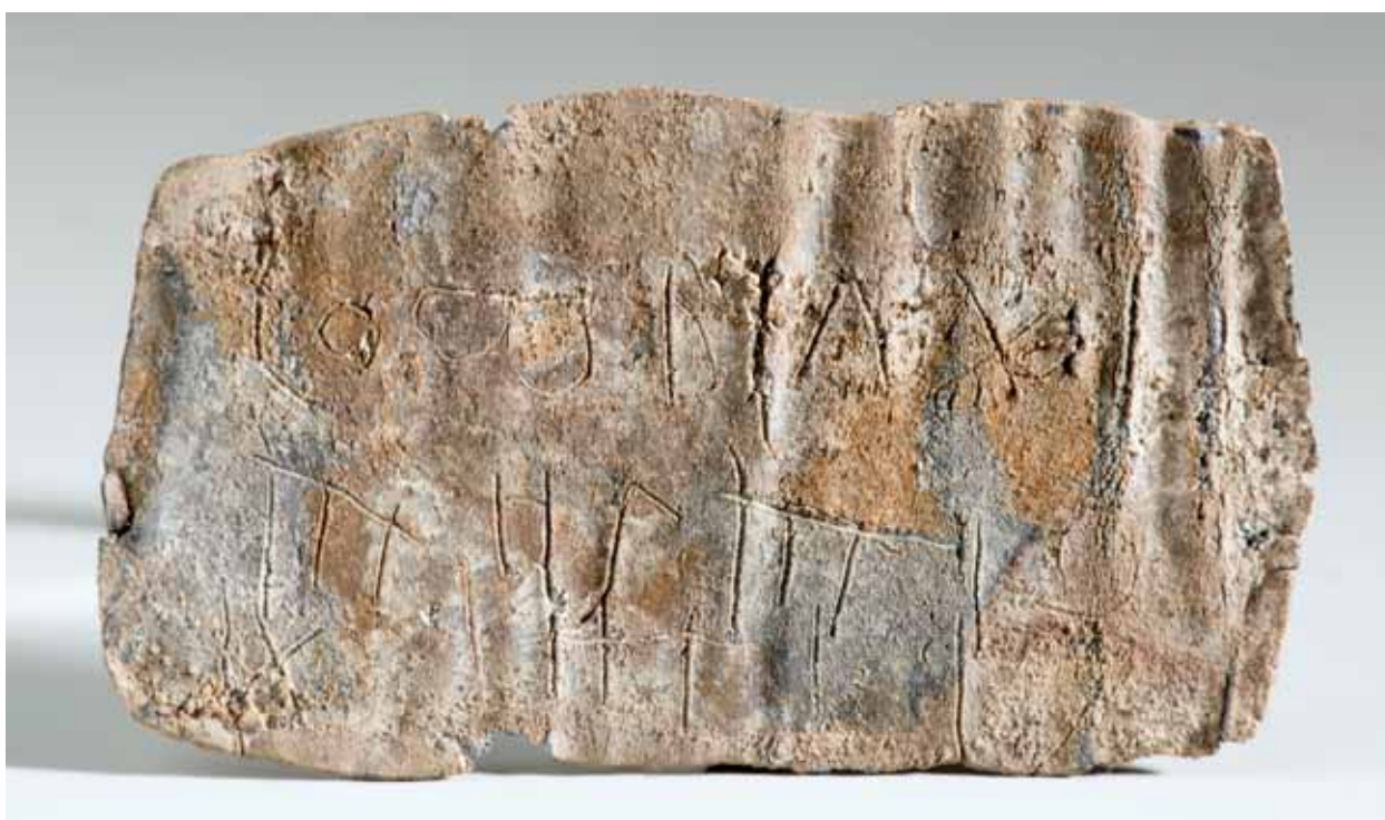
Afb. 24 Vloektablet uit Matilo. Er staat geen echte tekst op, alleen losse letters en symbolen, een beetje zoals vloeken in stripverhalen worden afgebeeld.

Op een plaatje lood graveerde je de vloek, je rolde het plaatje op, doorboorde het eventueel met een spijker en begroef het op een donkere, vochtige plaats, dichtbij de onderwereld en de geesten die moesten zorgen dat de vloek uitkwam.