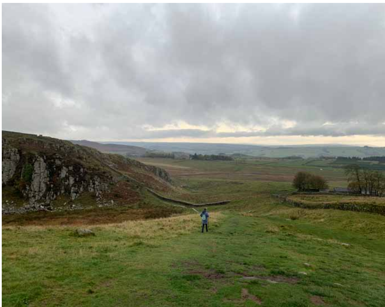
Afb. 14 Walking the wall in regen, wind en kou.

dit stuk tot een totaalervaring, waarbij we bijna medelijden kregen met de soldaten die hier toentertijd gelegerd waren. De prachtige vergezichten maakten het voor ons echter helemaal goed. Erfgoed in het wild ervaren met alle zintuigen, bij regen, kou en ongemak, daar kan eigenlijk geen museum aan tippen!