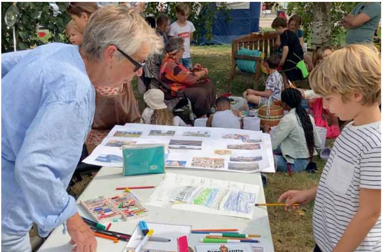
Afb. 7 Jong en oud ontwerpen hun droomwijk tijdens de workshops.