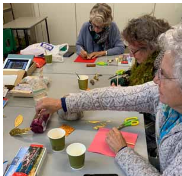
Afb. 15 Onze bijdrage aan het gemeenschapskunstproject 'Frontier Voices.'