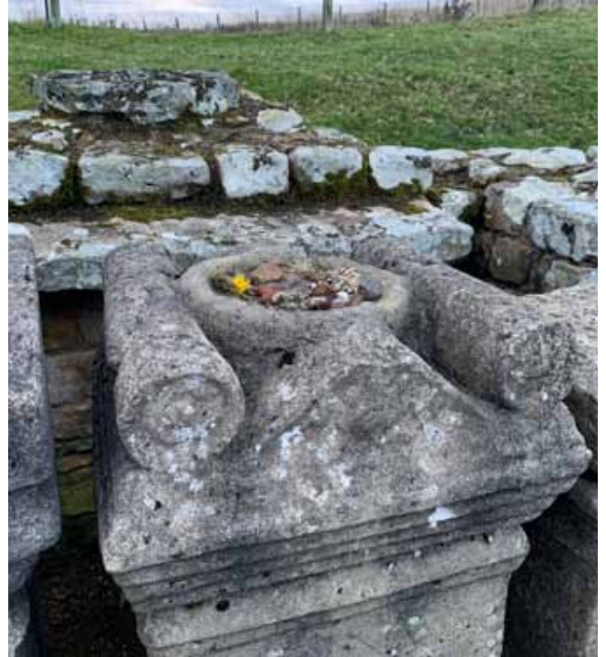
Afb. 13a De Mithrastempel bij Carrawbruch met hedendaagse offers.

In de musea langs de muur maakten we kennis met de ambachtelijke, religieuze en menselijke kant van de Romeinen. Leren schoenen, sieraden, gereedschap, kookpotten, textiel, handgeschreven briefjes op flinterdunne stukjes hout, graf- en altaarstenen en zelfs een damespruik van haarmos getuigen van het persoonlijke leven van de mensen langs de muur 2000 jaar geleden.