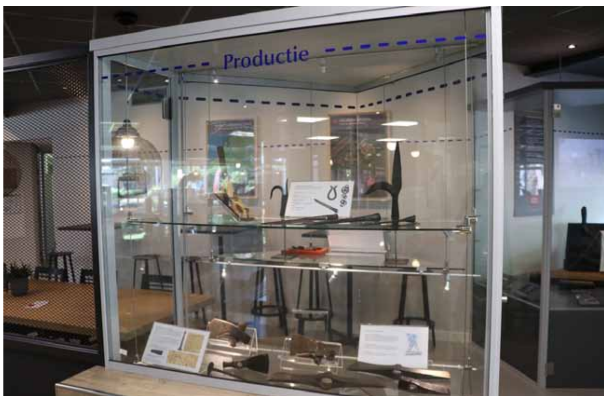
Afb. 23 Romeinse tentoonstelling in Grand Café De Haven bij Ipse de Bruggen in Zwammerdam.

De sociale component is eveneens redelijk te realiseren. Erfgoed als thema of locatie voor buurtactiviteiten, zoals de Buurtcamping die elk jaar in Park Matilo wordt georganiseerd door buurtbewoners, workshops of activiteiten voor bepaalde doelgroepen (bv. ouderen, jongeren, anderstaligen), vrijwilligers die samen voor het erfgoed zorgen (zoals de vrijwilligers van de Fabrica, de Historische Tuinen Matilo en het Voedselbos), het draagt allemaal bij aan de sociale cohesie in de buurt, aan eenzaamheidsbestrijding en het zorgen voor kwetsbare doelgroepen. In de praktijk blijken kinderen vaak een makkelijke doelgroep te zijn. Er mag echter meer aandacht uitgaan naar andere doelgroepen, zoals werklozen of schoolverlaters. Zij zijn lastiger te bereiken, maar kunnen veel baat hebben bij het werken met cultureel erfgoed.