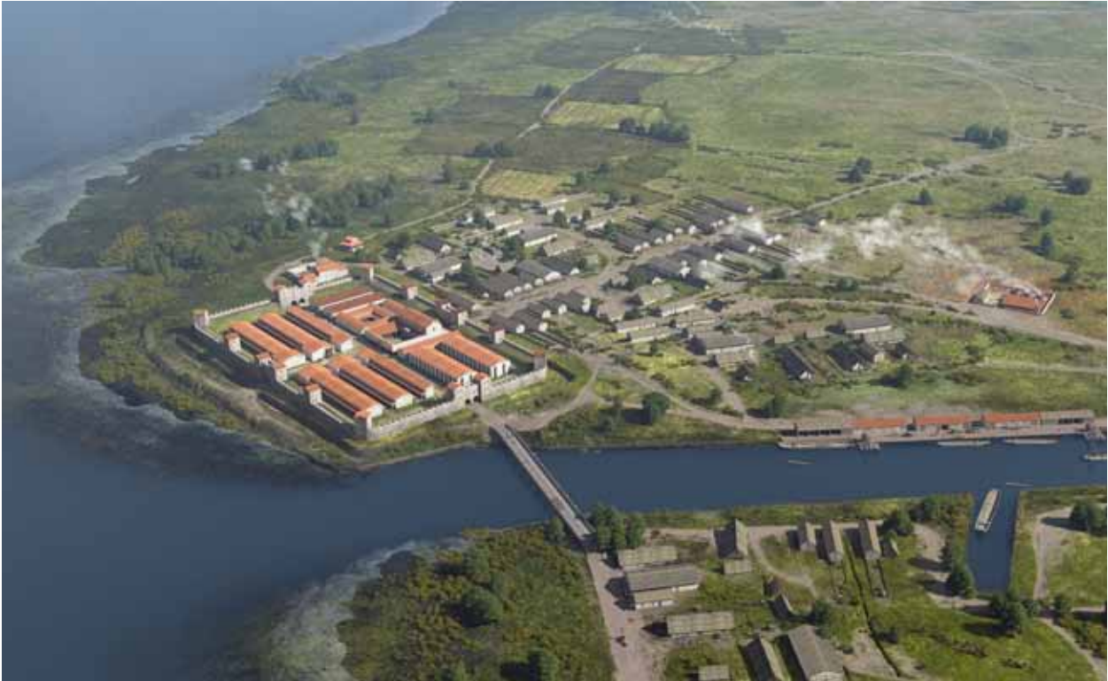
Afb. 3 Impressie van het Romeinse fort Matilo met vicus, haven en brug over het Kanaal van Corbulo.

Meer dan duizend jaar na het vertrek van de Romeinen vestigden de zusters van het Sint Margarethaconvent zich in Roomburg. In het convent woonden, baden en werkten