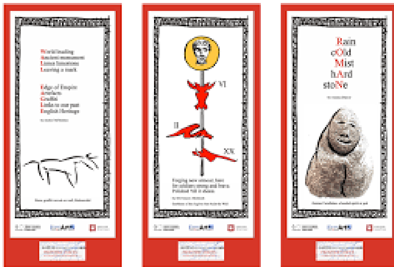
Afb. 28 Taalkunst van museumvrijwilligers en -bezoekers van het project Frontier Voices .

Wat een mooi idee: muurgedichten volgens Leidse traditie, gemaakt door de bewoners van het vernieuwde Meerburg.