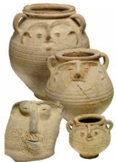
Afb. 11 Romeinse gezichtspotten, inspiratie voor de viltten potten.

Zij viltten, embosten, dichtten en schreven over hun ervaringen met het Romeinse erfgoed.