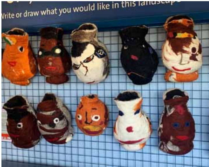
Afb. 12 Door schoolkinderen gevilte zelfportretten als 'gezichtspotten' in museum Segedunum.