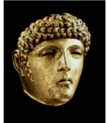
Afb. 1 Bronzen ruitermasker uit Matilo: 'Gordon'.

Archeologische vondsten getuigen van hun aanwezigheid: helm-onderdelen, slingerkogels en natuurlijk het beroemde ruitermasker 'Gordon'. Naast het fort lag een vicus, een burgerlijke nederzetting, waar de vrouwen, kinderen, handelaren en ambachtslieden woonden.