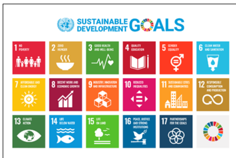
Afb. 22 De duurzame ontwikkelingsdoelen van de VN, waar erfgoed een belangrijke rol in speelt.