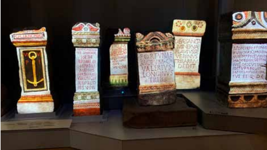
Afb. 26 Projecties van de oorspronkelijke kleuren op Romeinse altaarstenen in het Great North Museum in Newcastle upon Tyne.

Tijdens de ontwerpwedstrijd en ons bezoek aan de Muur van Hadrianus zijn vele goede ideeën en inspirerende voorbeelden voorbijgekomen voor de nieuwe wijk. We noemen er hier een paar.